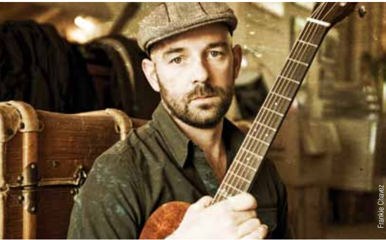
Frankie Chavez