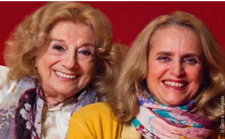
O Cerco a Leningrado