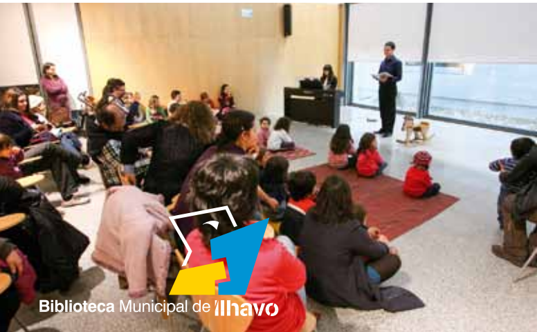
Biblioteca Municipal de Ílhavo