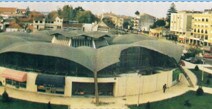
Mercado Municipal de Ílhavo

deliberação da Câmara Municipal, uma das suas mais desejadas aspirações - a inauguração do novo mercado municipal.