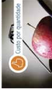
Custo por quantidade