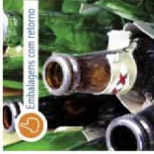
Embalagens com retorno