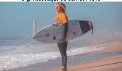
Praia da Costa Nova